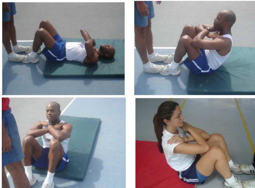
Figura 3 – Flexão de tronco sobre as coxas para os sexos masculino e feminino Neste exercício serão exigidos os mesmos padrões de execução para ambos os sexos.

Será avaliada através da flexão do tronco sobre as coxas.